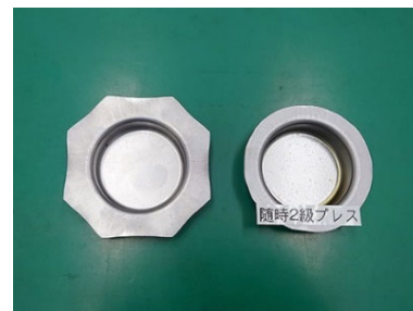
金属プレス実技課題

弊社には、 パナソニック・三菱電機・コマツ・クボタ等 、大手メーカーで活躍した人財や、 機械加工・放電加工・金型・機械組立・機械検査・電子機器・鉄鋼・塗装等のものづくりマイスター50人以上のマンパワー と、特級・1級・2級・3級等多くの技能検定受験支援で高い合格率を誇るノウハウをセットにして、基礎・随時級の技能検定制度を支援させて頂くバックをご用意いたしました。また更に、検定試験を実施する技能検定委員の派遣も同時に可能です。