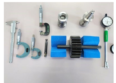
機械検査実技課題

日本で数少ない大手企業生産技術職OBが集う民間訓練施設です。休日対応も可能です！