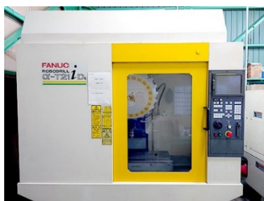
マシニングセンター