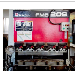
プレスブレーキ アマダ製【FMB-208】

金属プレス1級・2級 外国人実習生用 随時2級・3級・基礎級等の各金型保有 検定試験実施可能