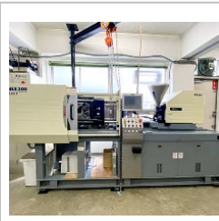
プラスチック電動式射出成型機(30t) 日精樹脂工業製【NEX300】