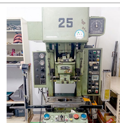
金属プレス アマダ製【TP-25C-X】

金属プレス1級・2級 外国人実習生用 随時2級・3級・基礎級等の各金型保有 検定試験実施可能