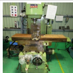
立型フライス盤 大隈豊和機械製【STM-2V】

<仕様> フナック製F-21i-T付 10インチ油圧チャック ツールホルダー8本 芯押し台付