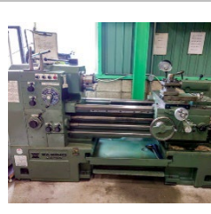
普通旋盤 ワシノ製【LE-19K】