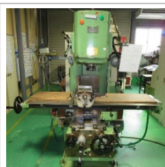
立型フライス盤 日立精機製【2MF-V】