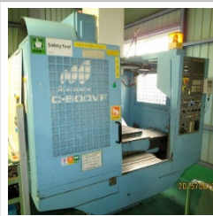
マシニングセンター 松浦機械製【MC-600VF】