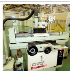
平面研削盤 岡本工作製【PFG-450DX】